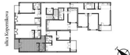
POZICIJA STANA U OBJEKTU