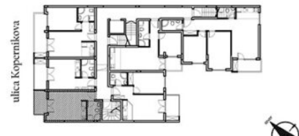
POZICIJA STANA U OBJEKTU