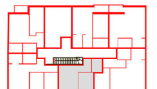
S20 STAN 20, jednoiposoban-36,82m2 SPRAT NAPOMENA

D.O.O."KONSTRUKTOR INŽENJERING", Ul.Branka Baića 82, Novi Sad 064/2953-806