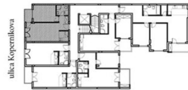
POZICIJA STANA U OBJEKTU